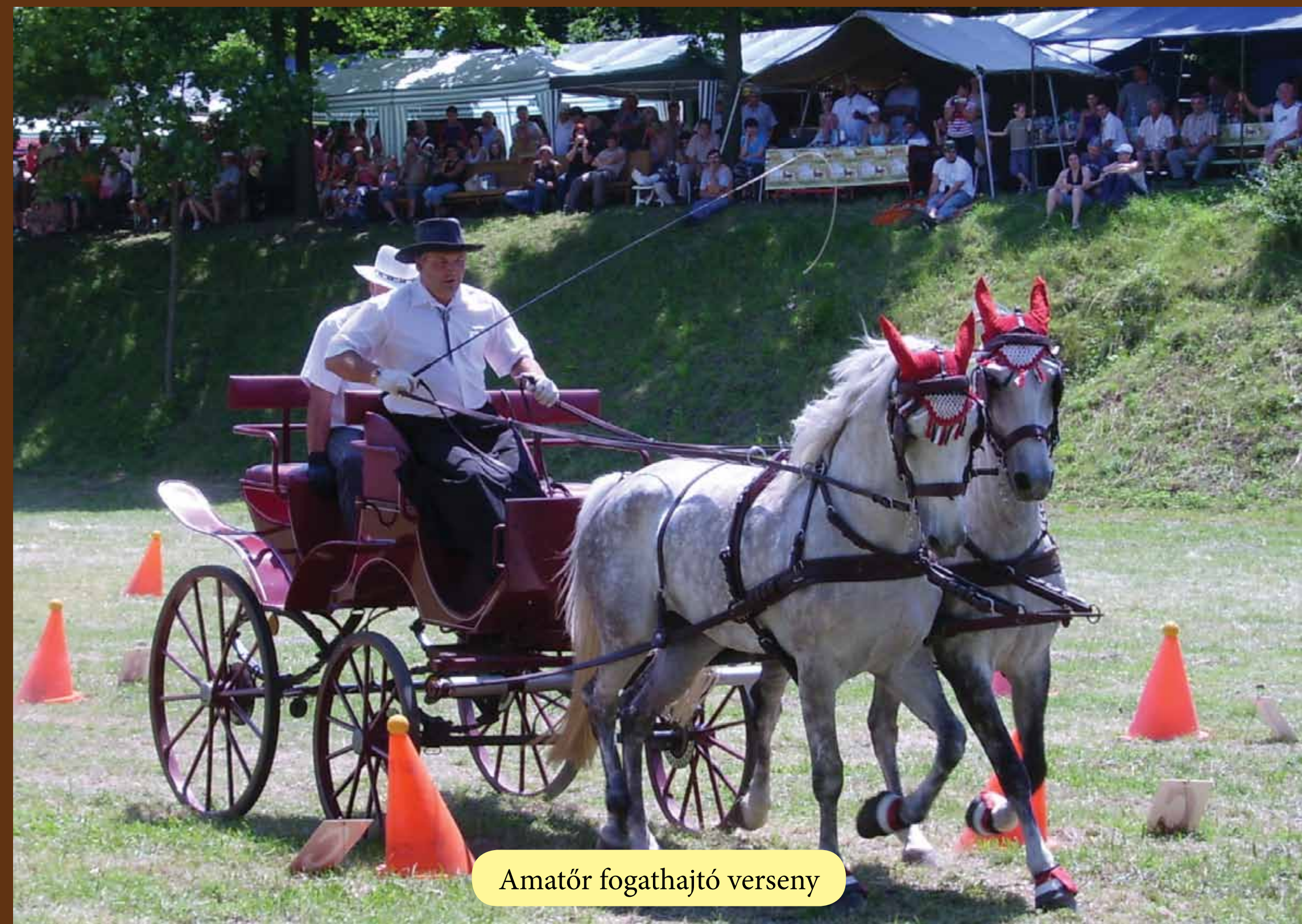
Amatőr fogathajtó verseny