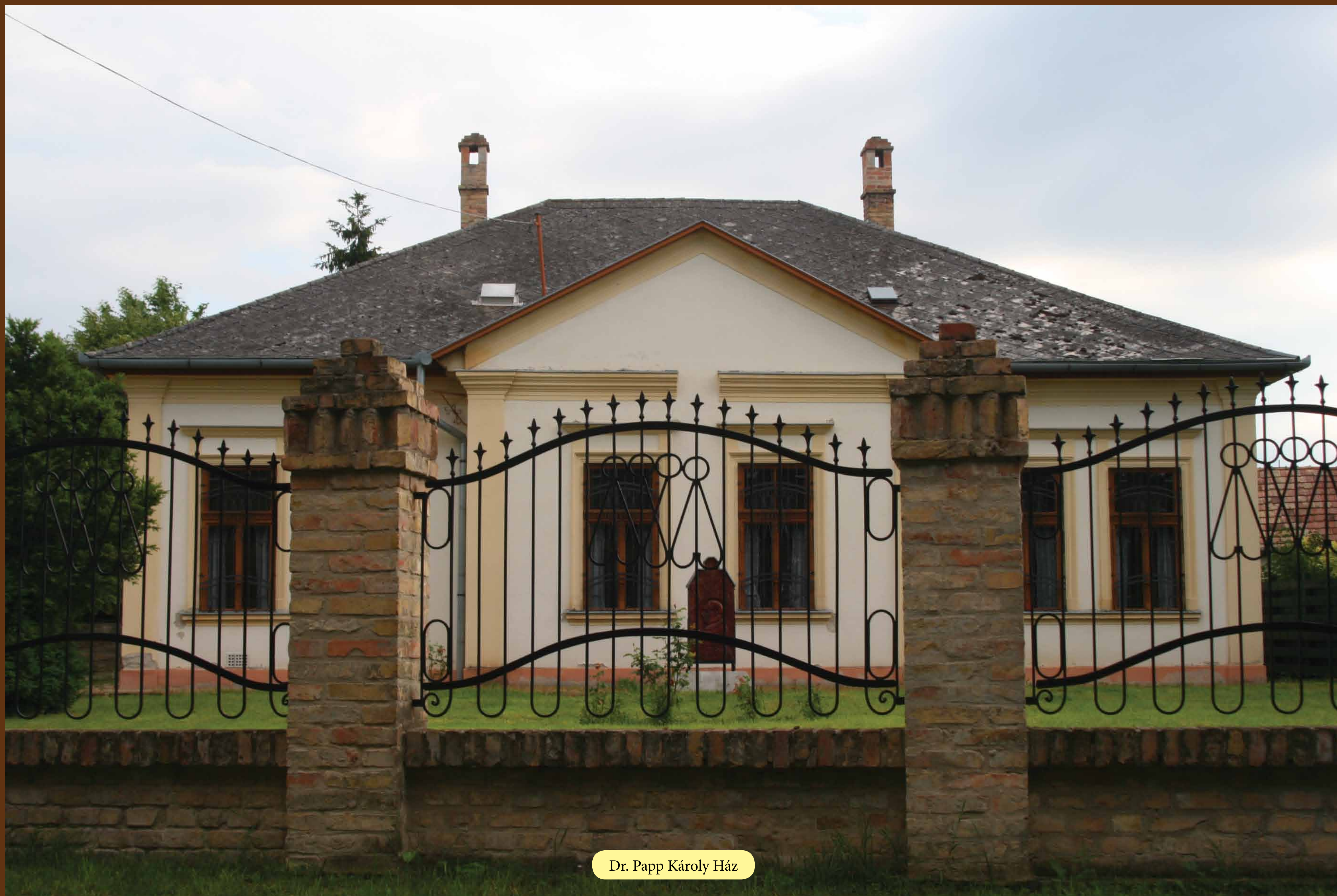
Dr. Papp Károly Ház