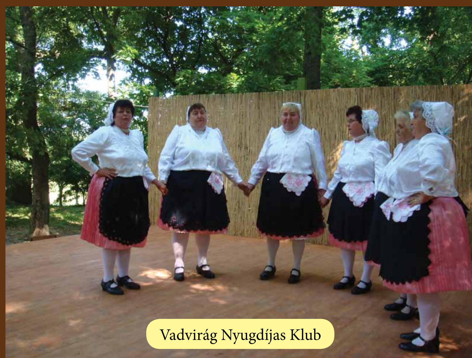
Vadvirág Nyugdíjas Klub