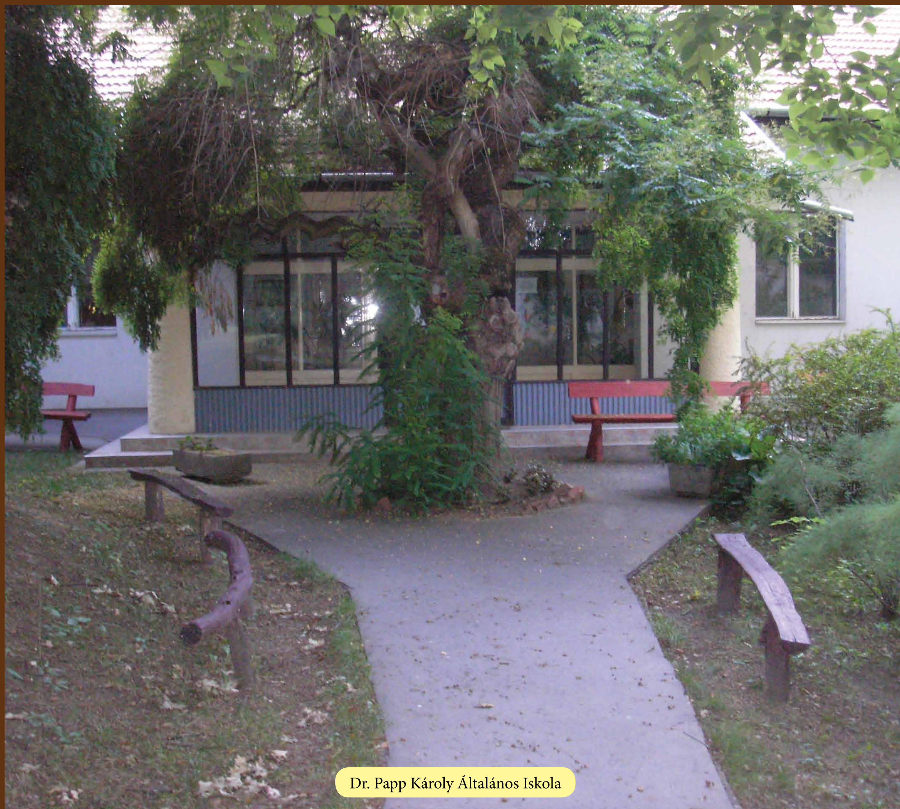
Dr. Papp Károly Általános Iskola