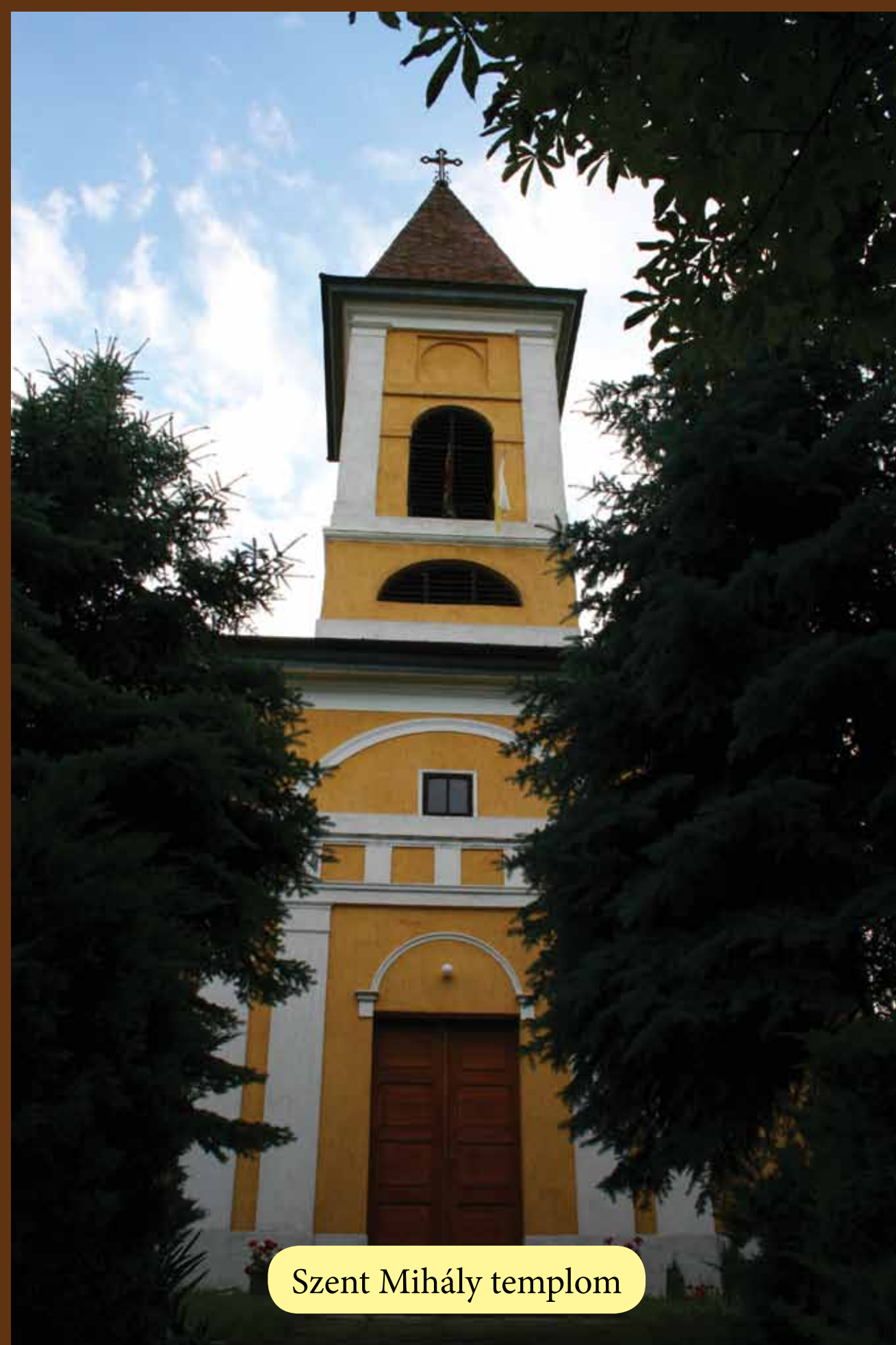
Szent Mihály templom