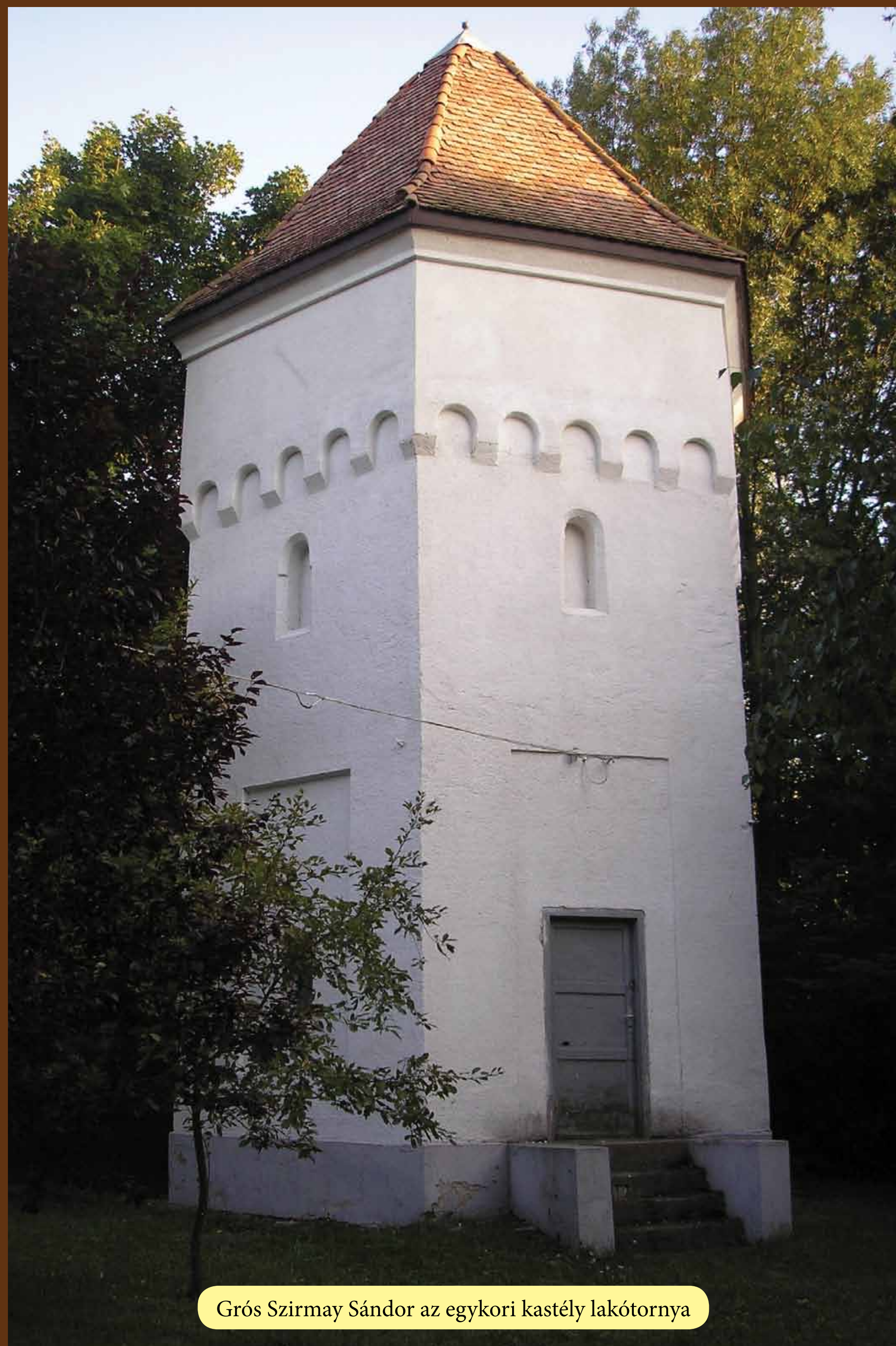
Grós Szirmay Sándor az egykori kastély lakótornya