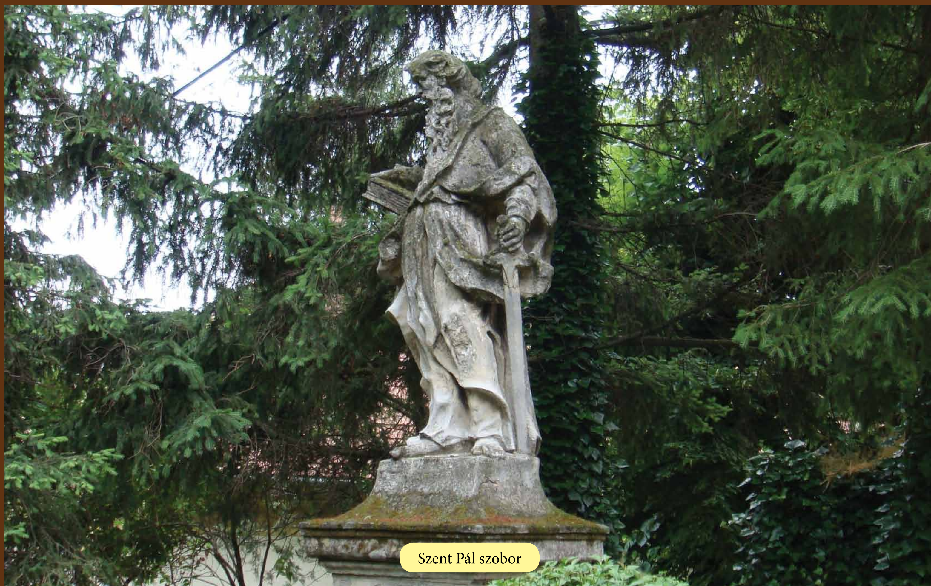
Szent Pál szobor