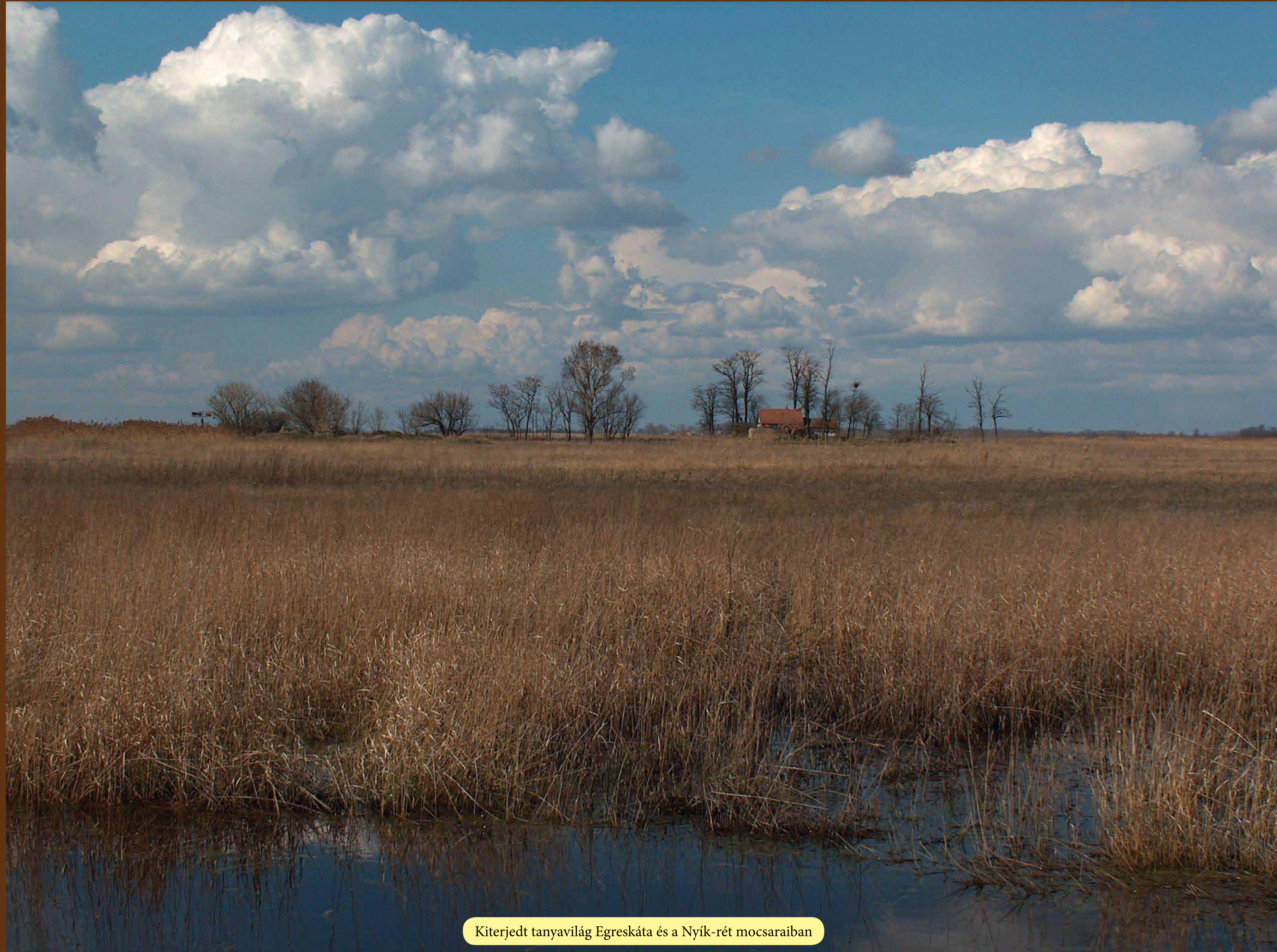
Kiterjedt tanyavilág Egreskátá és a Nyík-rét mocsaraiban