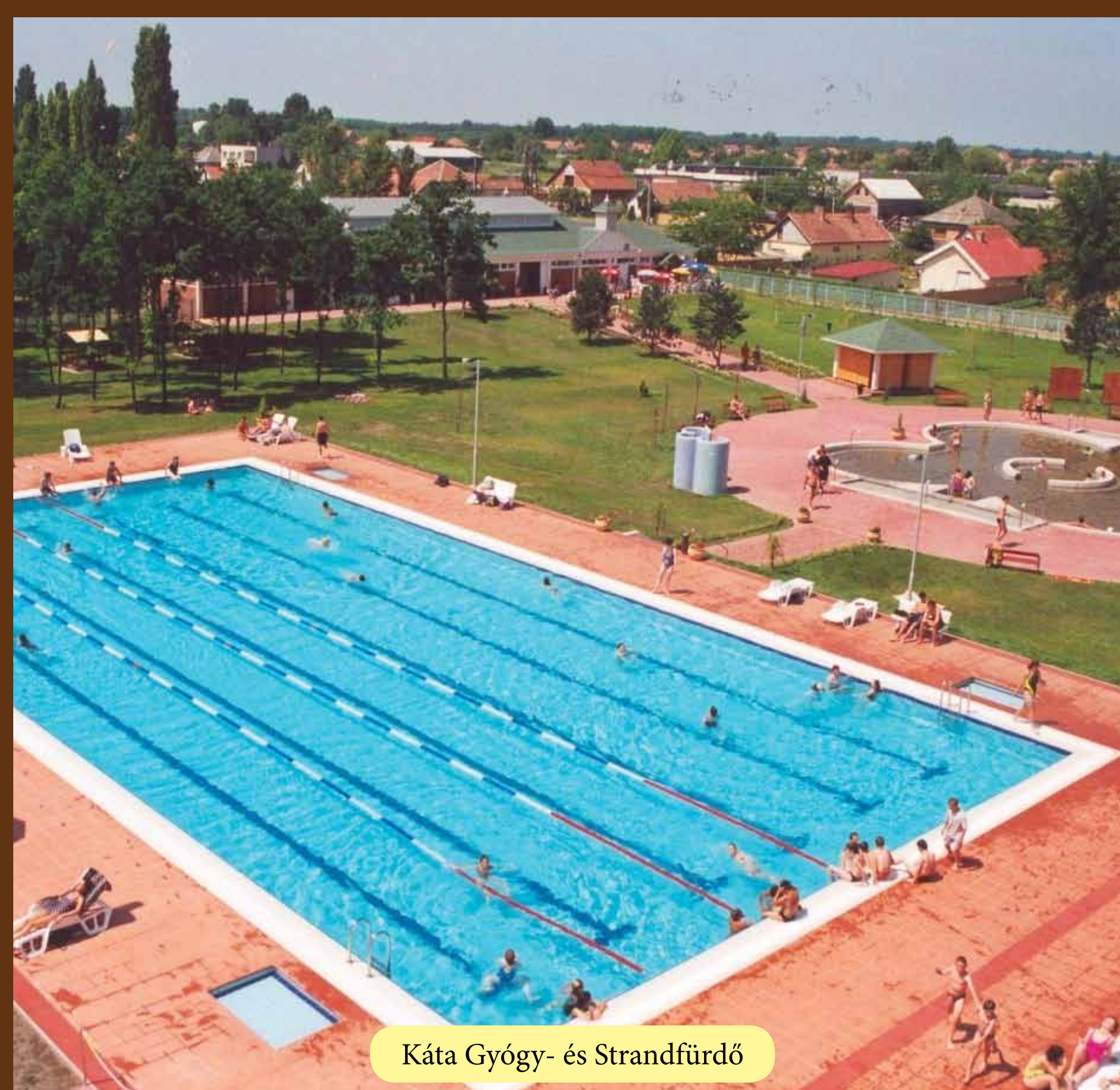
Káta Gyógy- és Strandfürdő