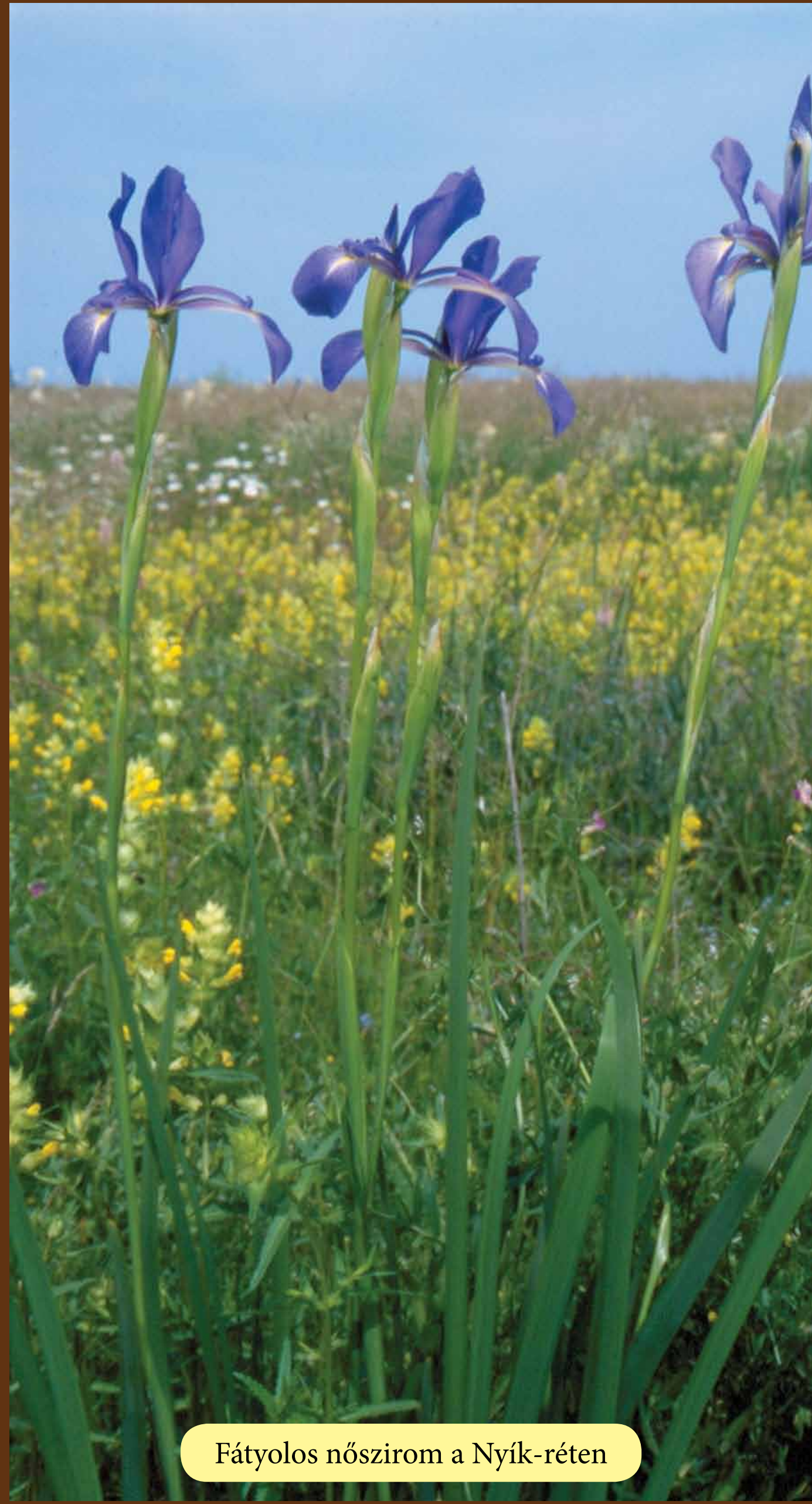
Fátyolos nőszirm a Nyik-réten