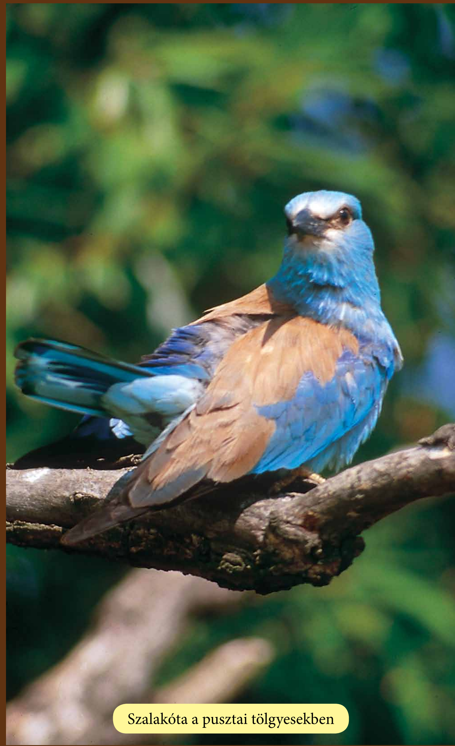
Szalakóta a pusztai tölgyesekben