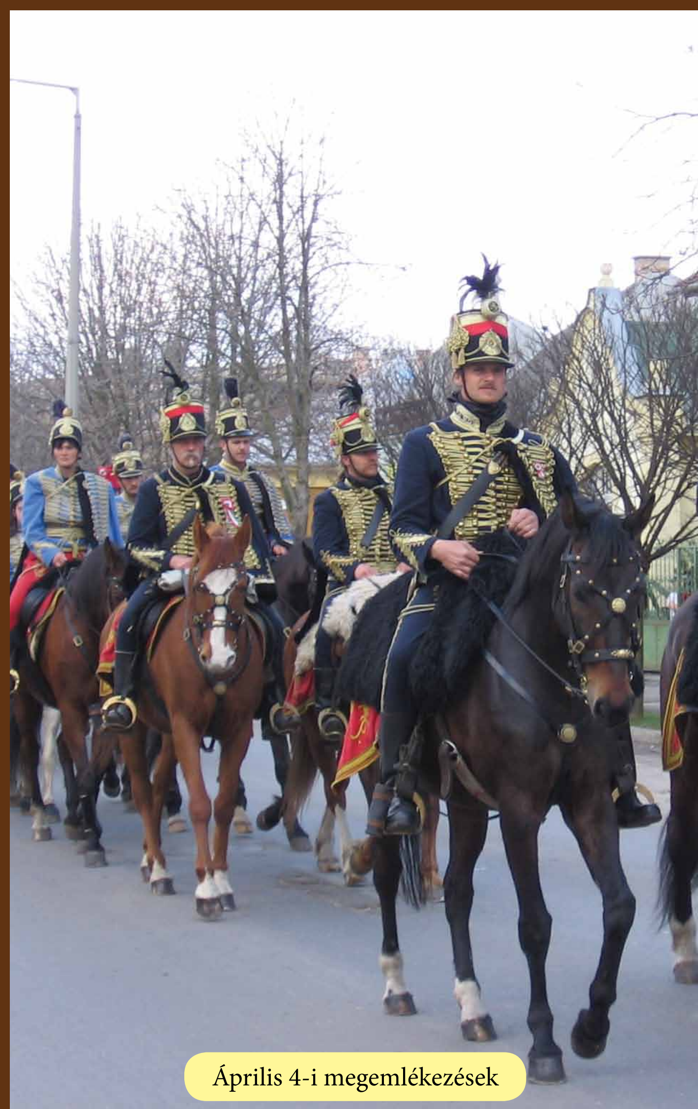
Április 4-i megemlékezések