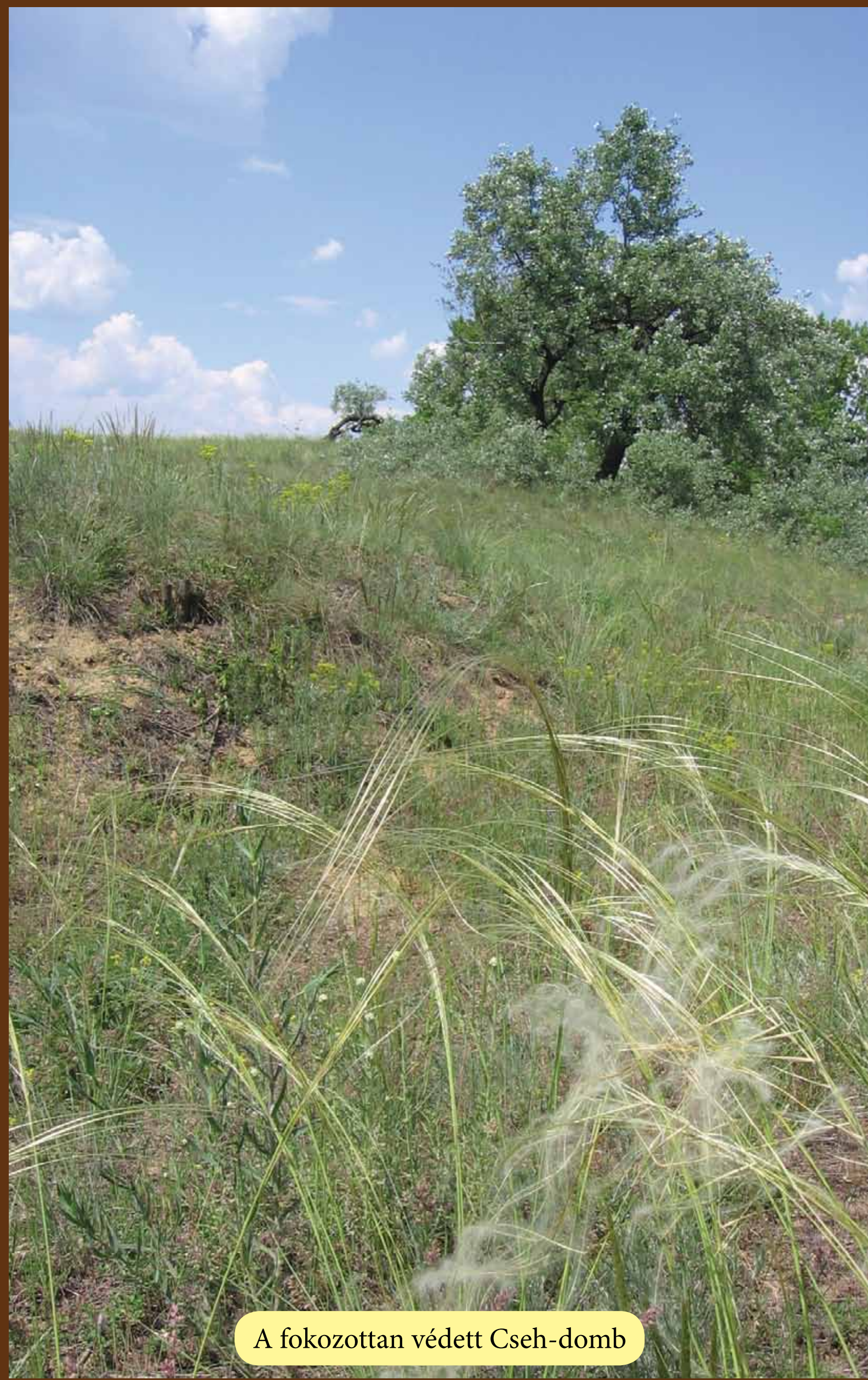
A fokozottan védett Cseh-domb