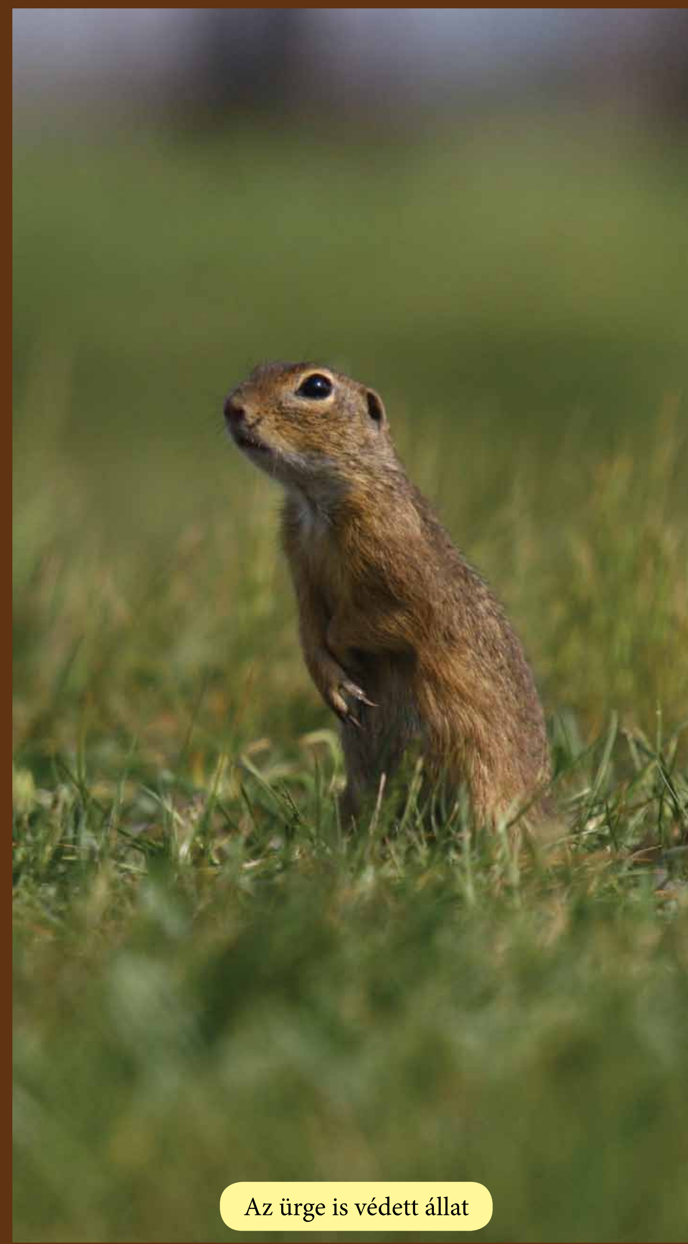
Az ürge is védett állat