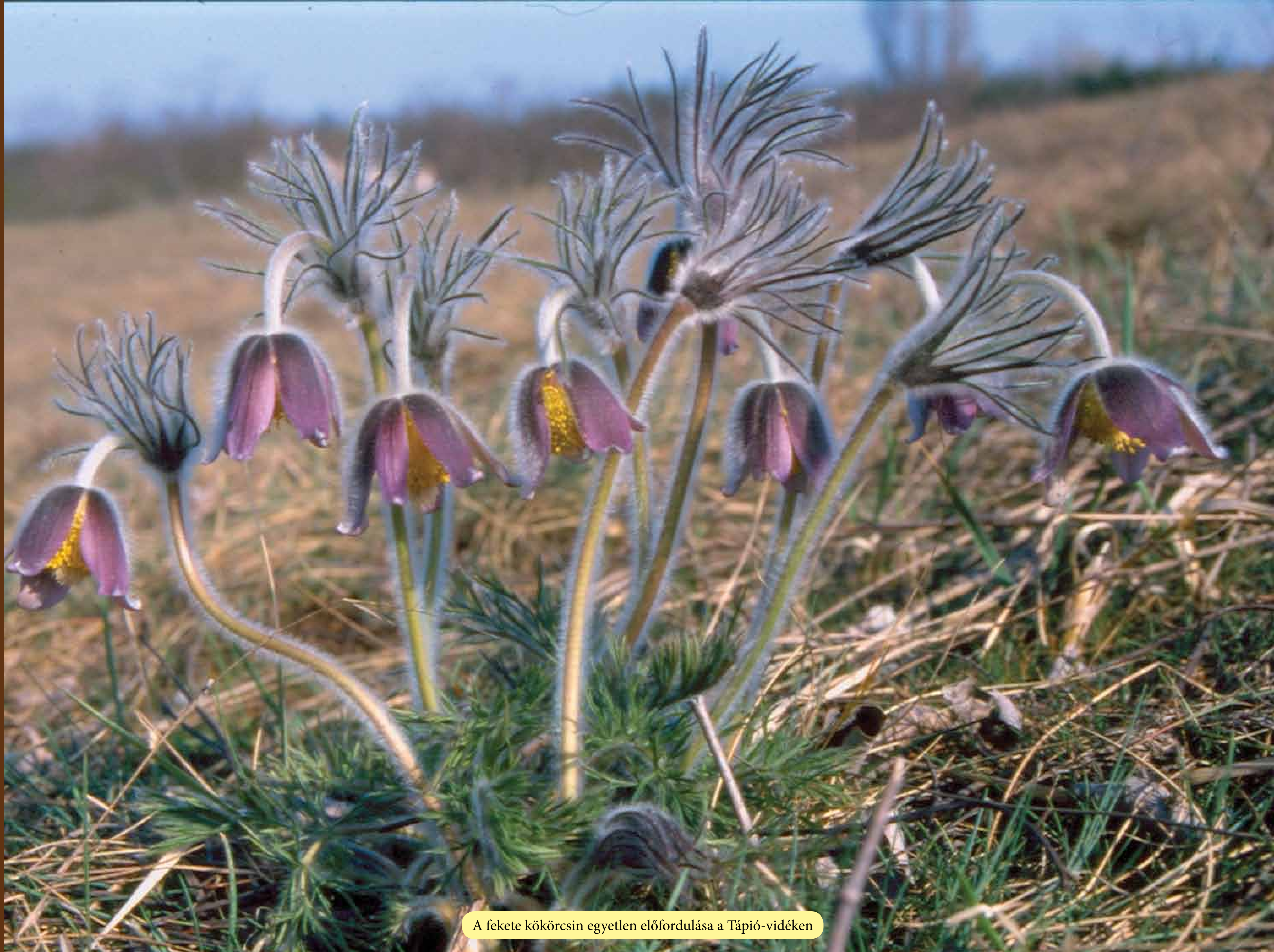
A fekete kökörcsin egyetlen előfordulása a Tápió-vidéken