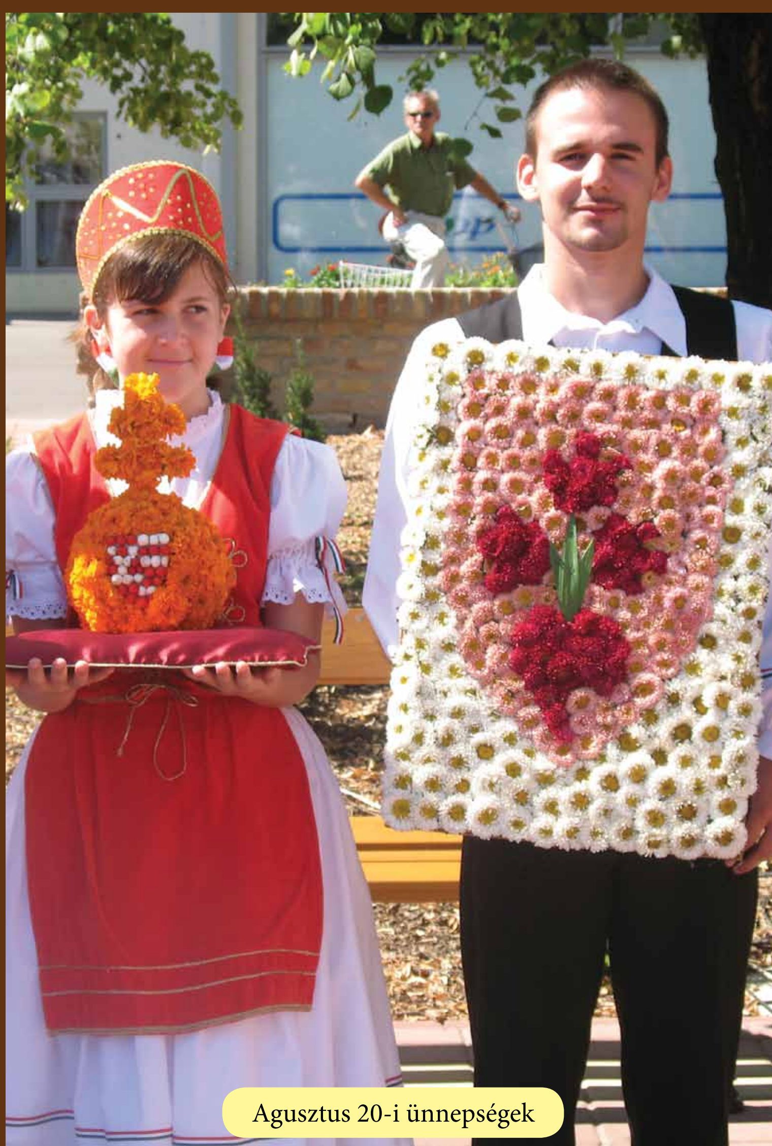
Agusztus 20-i ünnepek