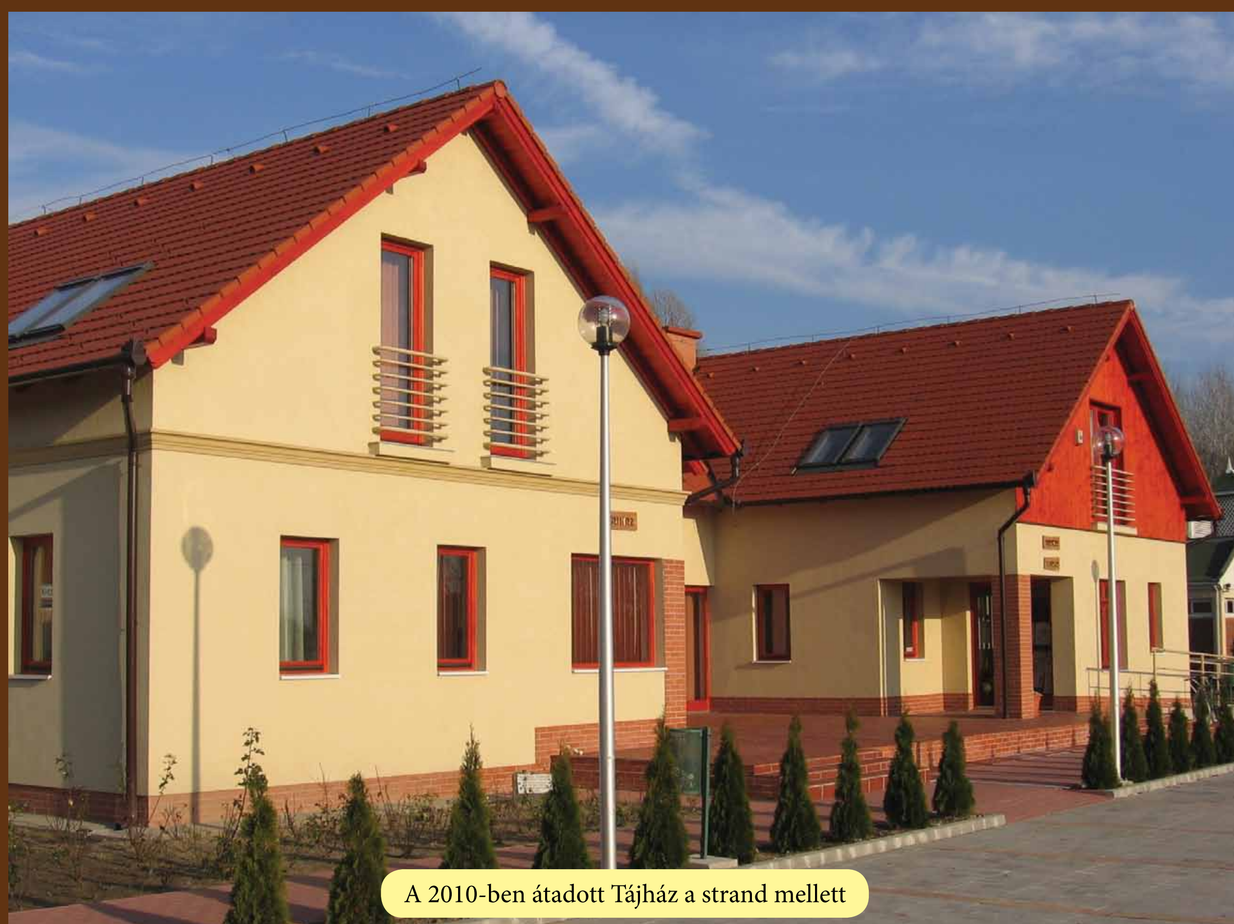
A 2010-ben átadott Tájház a strand mellett