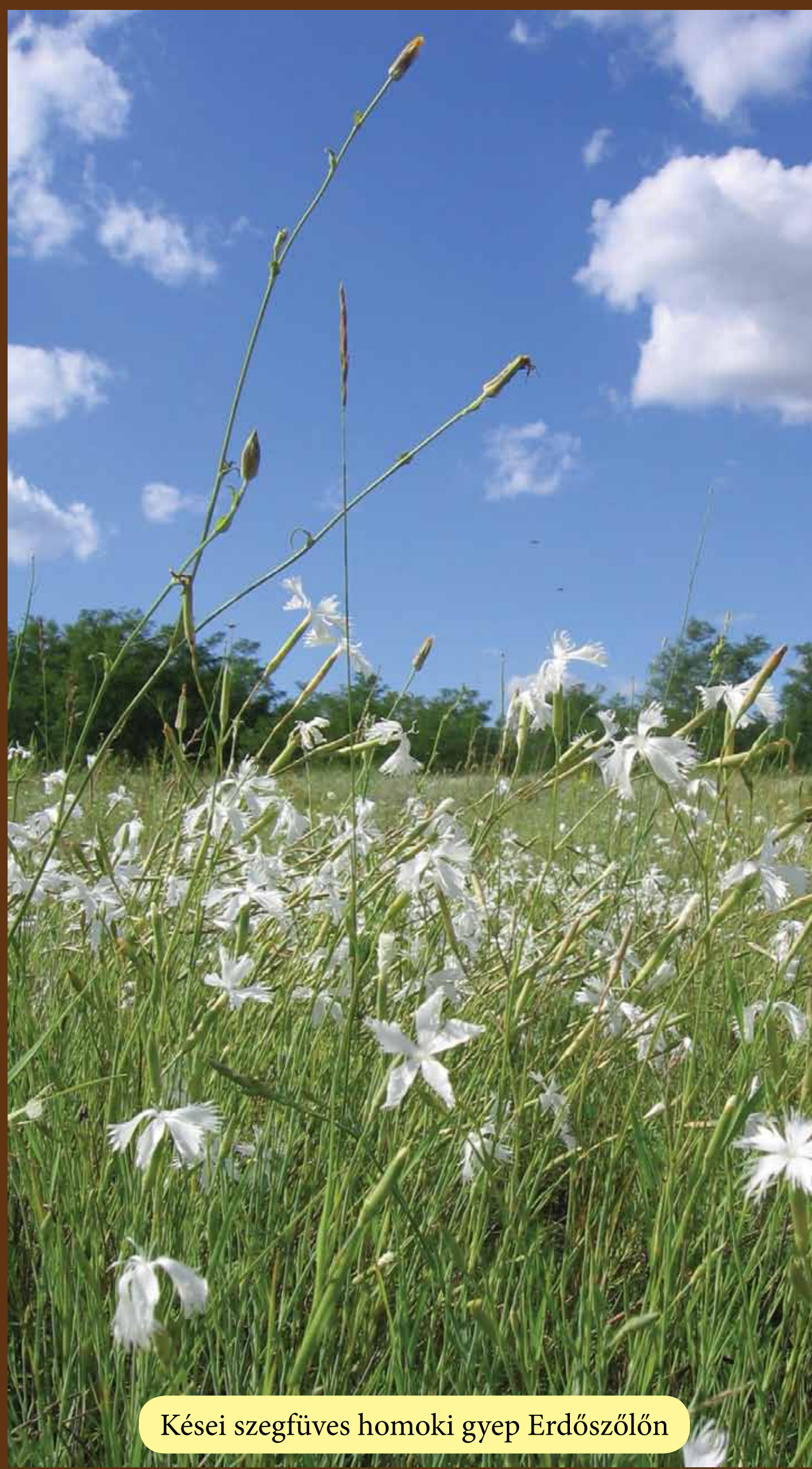
Kései szegfüves homoki gyepek Erdőszőlőn