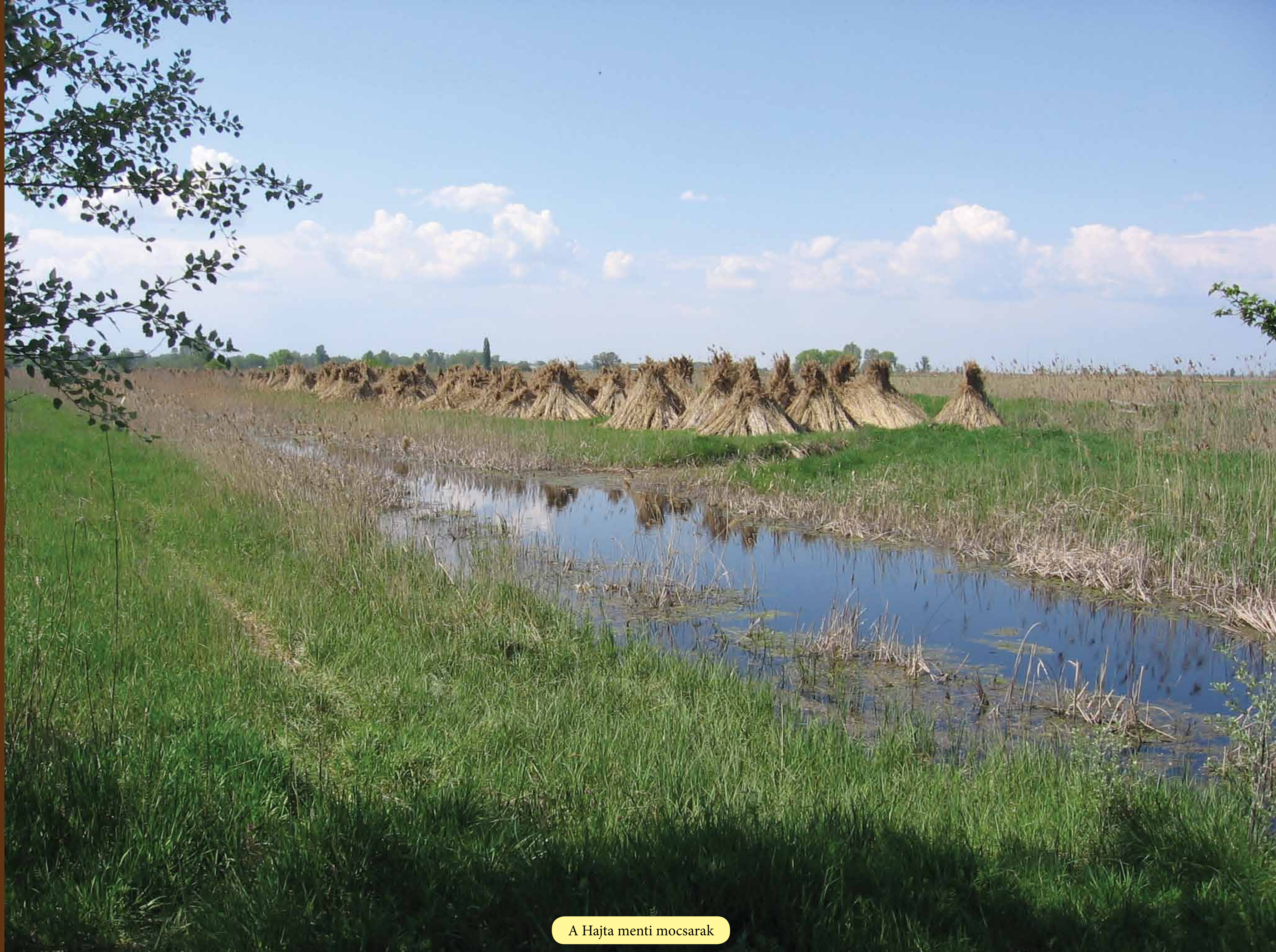
A Hajta menti mocsarak